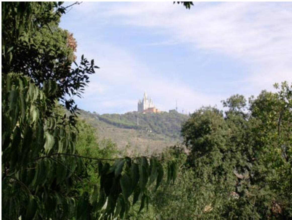
Vista del Tibidabo desde uno de los salones de la EINA.