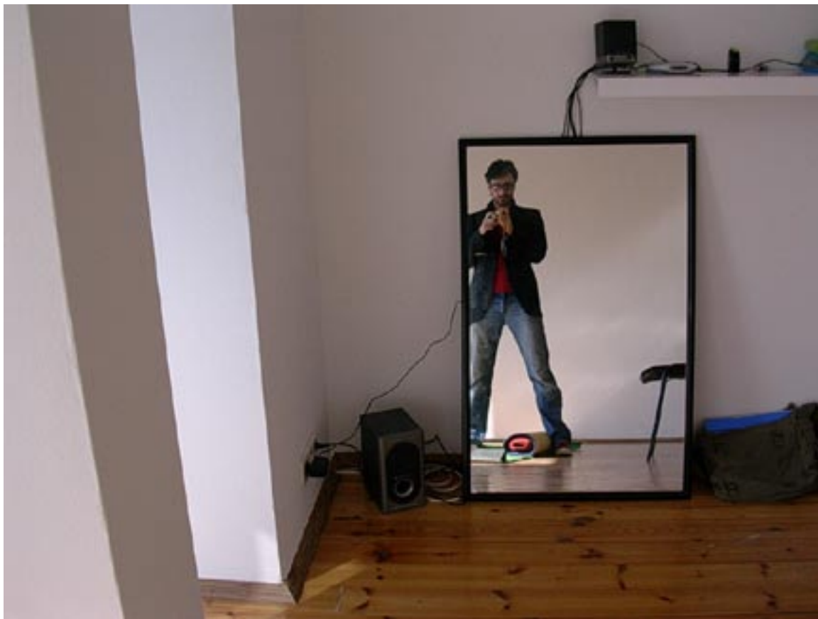
Autorretrato, mi sala. AMO MI PISO. Esta en el noveno piso. No presumo solo solicito visitas...