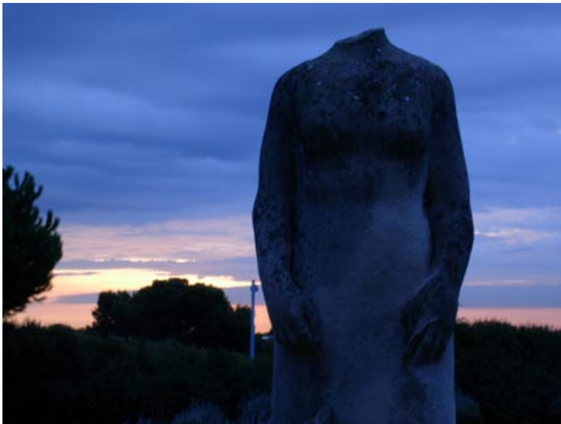
Estatua decapitada en una destacada batalla de la Guerra Civil, en el patio de la escuela.