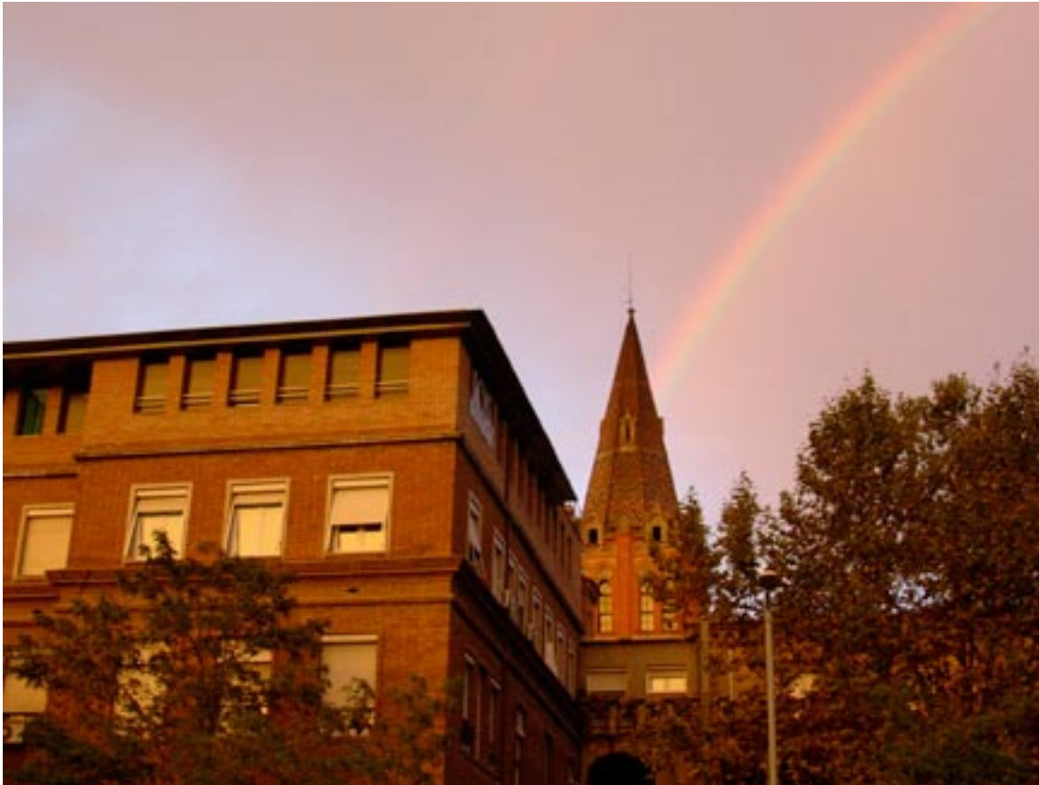
Mi primer arco iris Ibérico, a patín rumbo al EINA. Camino mínimo una hora al día, pa que sepan.