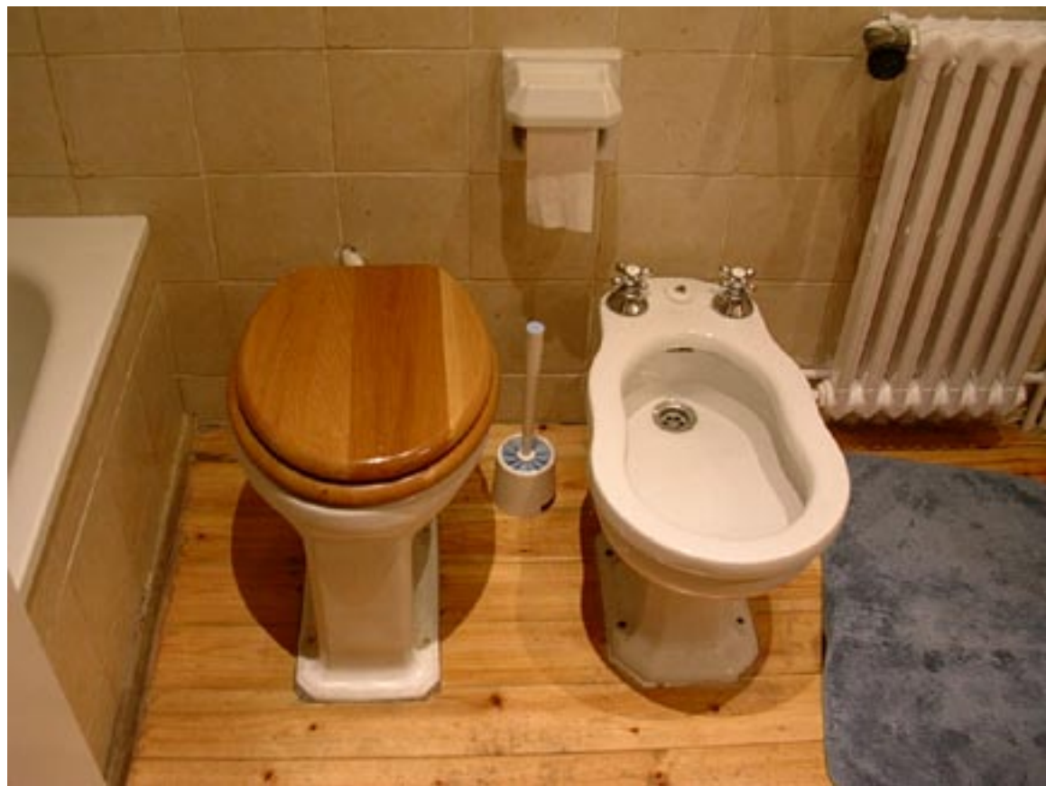
Cuando en roma...