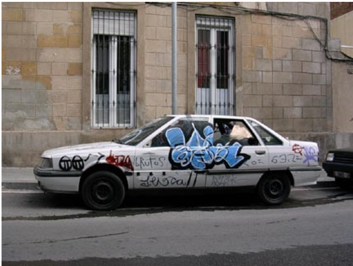
Mero abajo de el primer depa, no la mejor parte de la ciudad. Por favor noten las ventanas rotas.