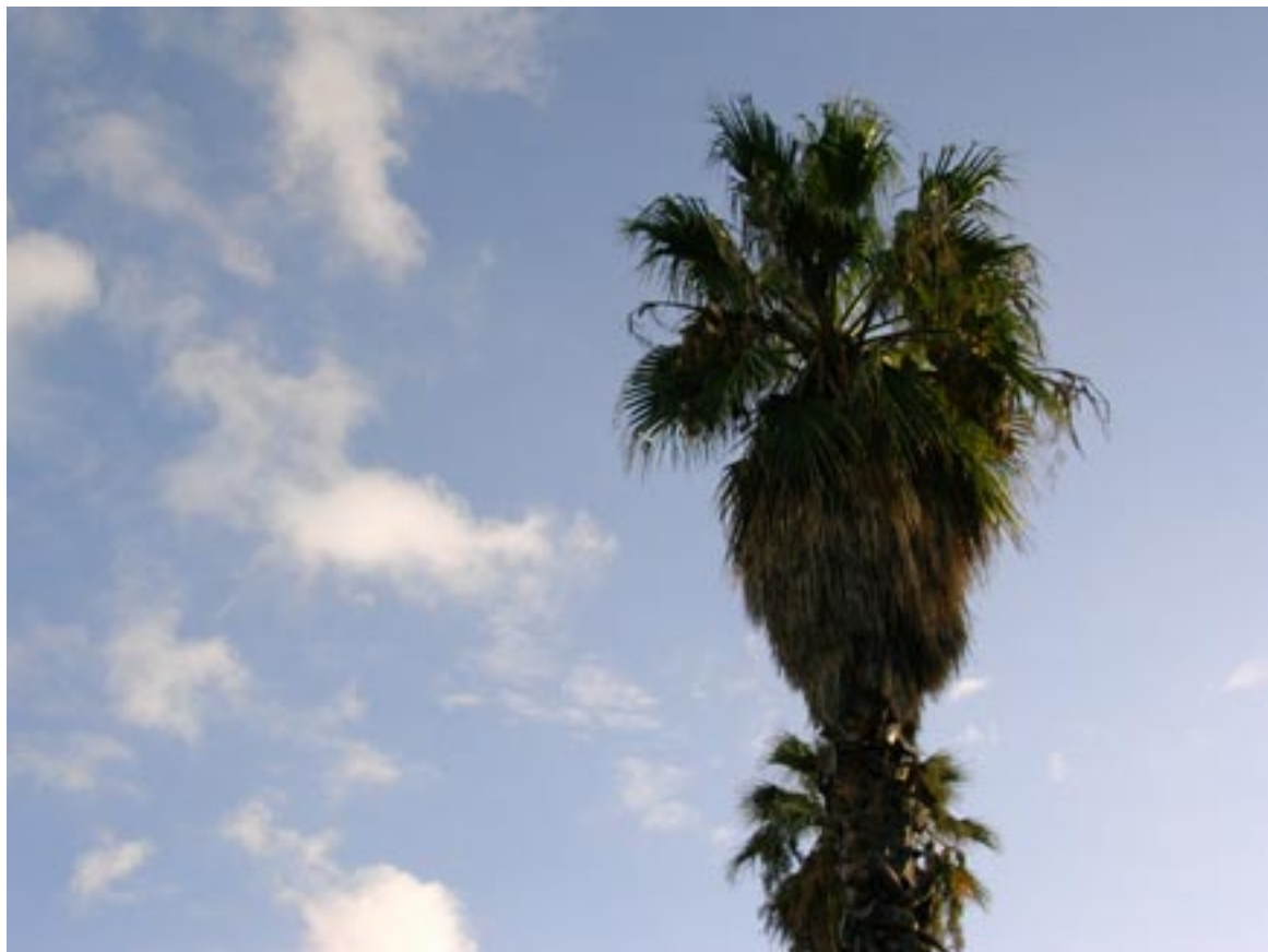
Una palmera en el patio de la escuela.