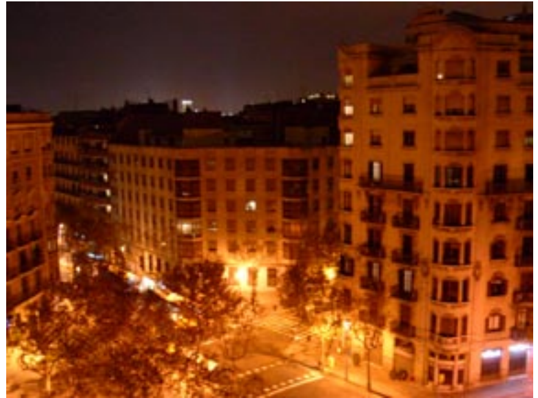
Distintas vistas nocturnas desde la sala, BCN es muy bella de noche.