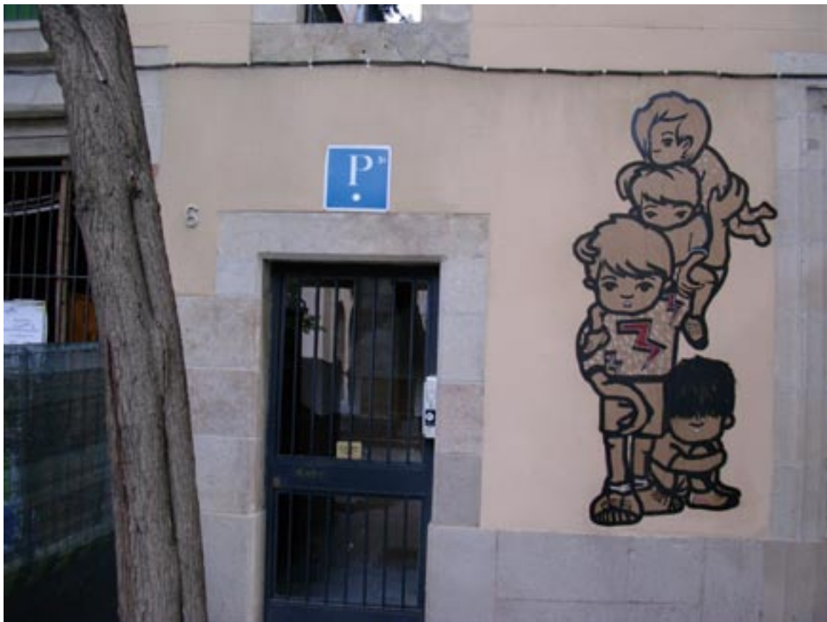
Un Grafitesco Barcelonesco, muy cute, pero peligroso.