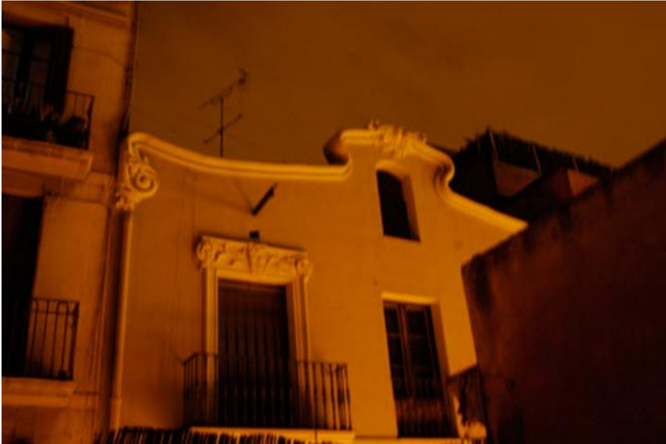
BCN de noche.