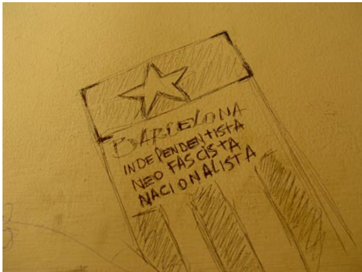
Un Grafitesco Barcelonesco, pero político.