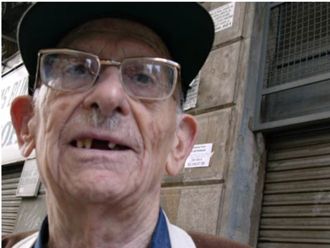
Mi tocayo, vecino y amigo; ex Jesuita, ex combatiente Republicano, Comentarista Social...